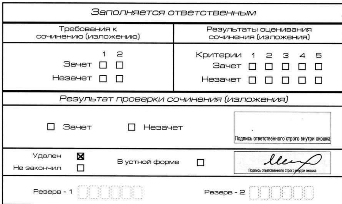
Рис. 11. Заполнение полей нижней части бланка регистрации (участник удален с экзамена)